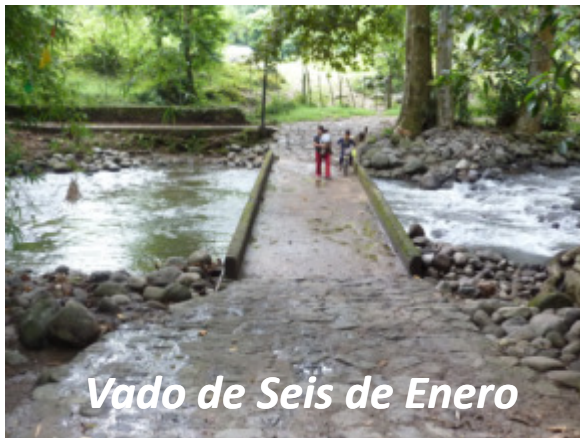
Vado de Seis de Enero

..lo cierto, es que niveles similares o muy cercanos de Caudales extraordinarios, los hemos tenido en ocasiones anteriores, talvez no tan intensos como el del Huracán Barry, pero si muy cercanos, tal como puede demostrarse comparando las imágenes tomadas por nosotros mismos en el río Pixquiac en diferentes fechas, que se muestran a continuación: