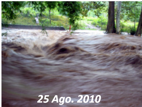
25 Ago. 2010