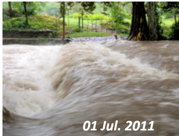
01 Jul. 2011