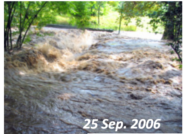
25 Sep. 2006