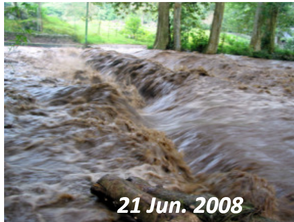
21 Jun. 2008