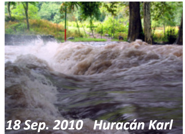
18 Sep. 2010 Huracán Karl